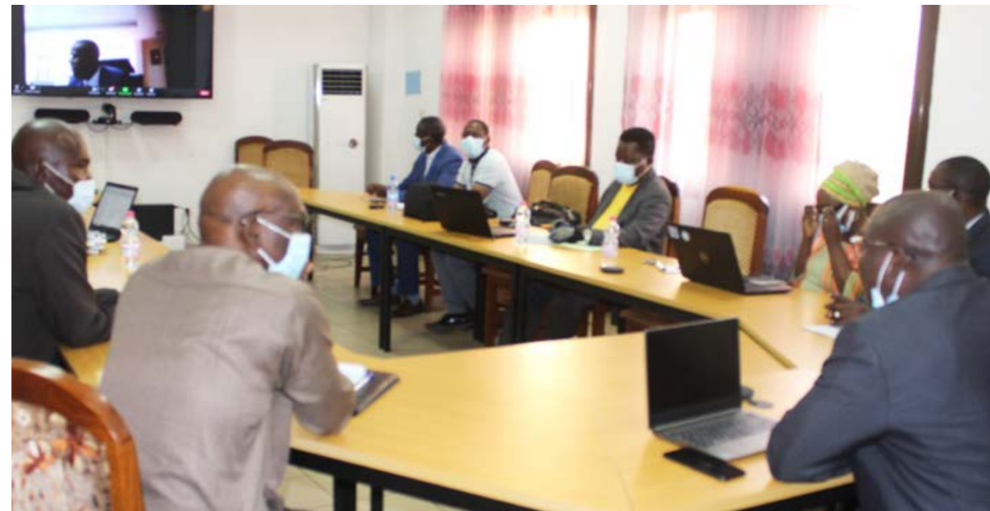
Table-ronde des bailleurs RGPH5, le Ministre de l'Economie et des Finances, Alousseni SANOU (en écran), en Visioconférence avec les PTF le 11 mars 2021

L'Institut National de la Statistique (INSTAT), sous l'égide du Ministère de l'Economie et des Finances, envisage de mettre en œuvre, en novembre - décembre 2021, le dénombrement du Cinquième Recensement Général de la Population et de l'Habitat (RGPH5). La conduite dudit recensement est un processus coûteux, dont la réalisation exige des moyens humains, matériels et financiers considérables.