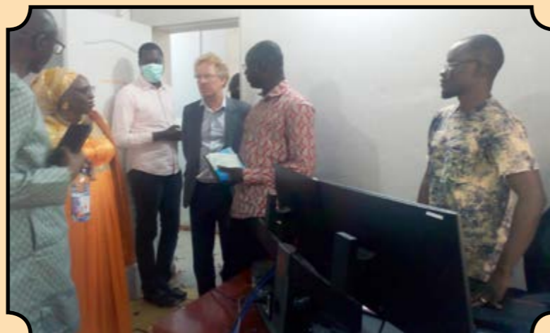
Le coordinateur du Projet INSTAT/SCB en visite au BCR

La visite a pris fin par un tour d'horizon dans différentes salles de saisie et les magasins contenant le matériel en cours d'acquisition pour le dénombrement.