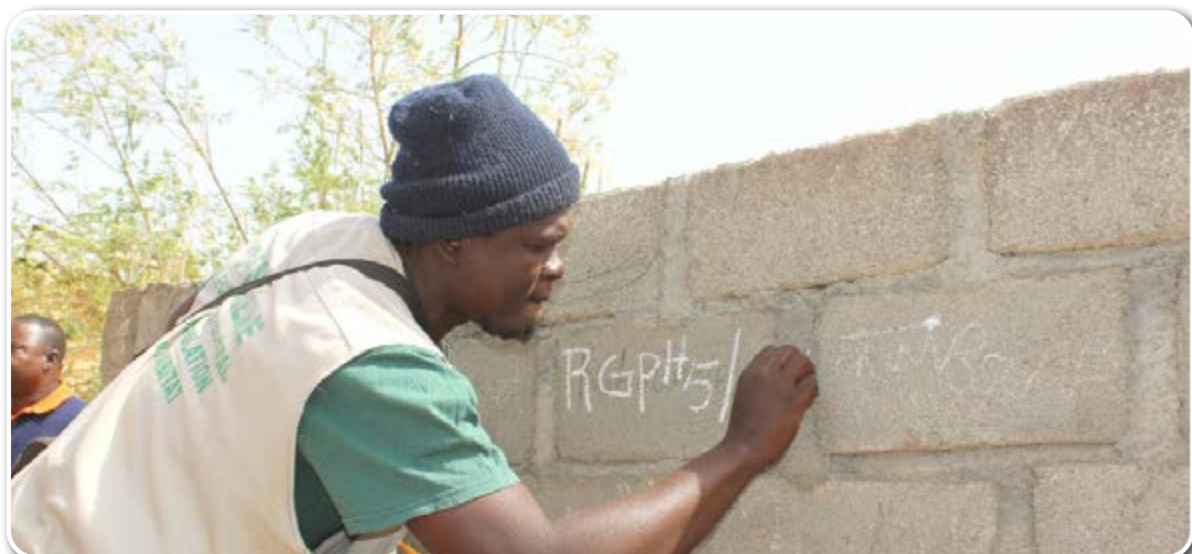
Agent cartographe, marquant une concession après son repérage, le 25 Janvier 2020 à Nèguèla