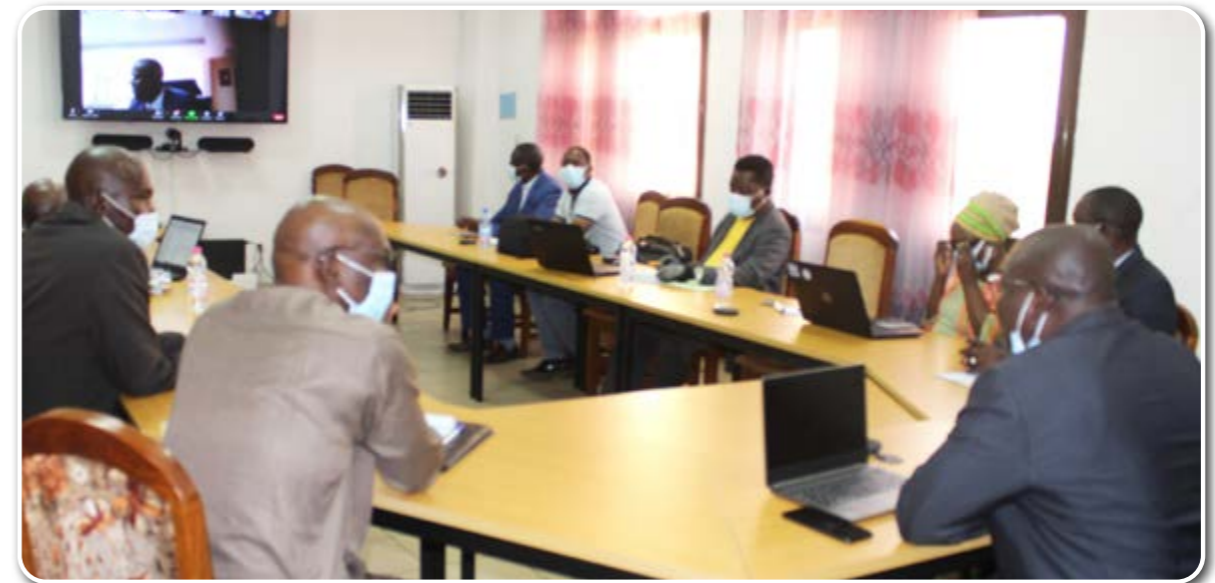
Table-ronde des bailleurs RGPH5, le Ministre de l'Economie et des Finances en Visioconférence avec les PTF le 11 mars 2021