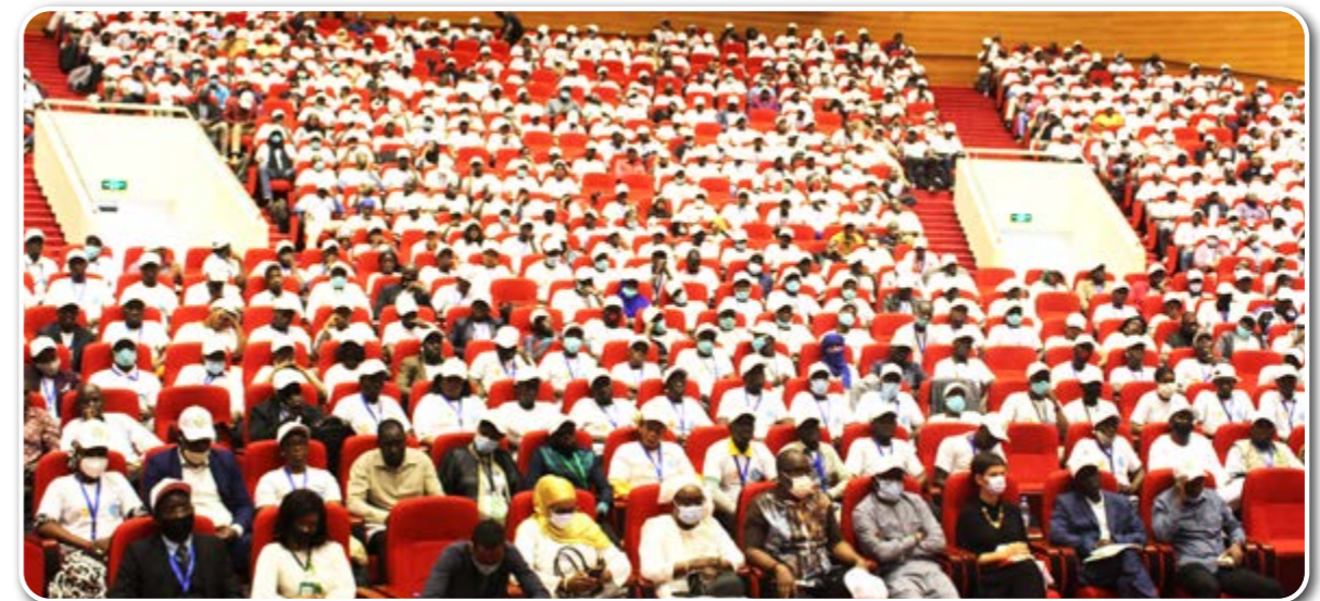
Une vue de salle à l'occasion de la clôture de la Formation des contrôleurs TIC, le 07 septembre 2021