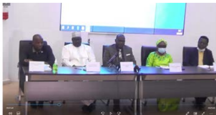
Une vue du présidium de l'atelier de sensibilisation des Médias

La rencontre qui a regroupé les acteurs des médias est la première d'une série qui devra également concerner les chercheurs, les structures nationales et déconcentrées de l'Etat, les collectivités territoriales, les organisations internationales et régionales, le secteur privé, la société civile et même les étudiants. L'objectif principal des Cafés statistiques est de créer un cadre d'échanges entre les producteurs et les utilisateurs de statistiques pour une meilleure compréhension de l'intérêt de la statistique dans le processus de développement du pays.