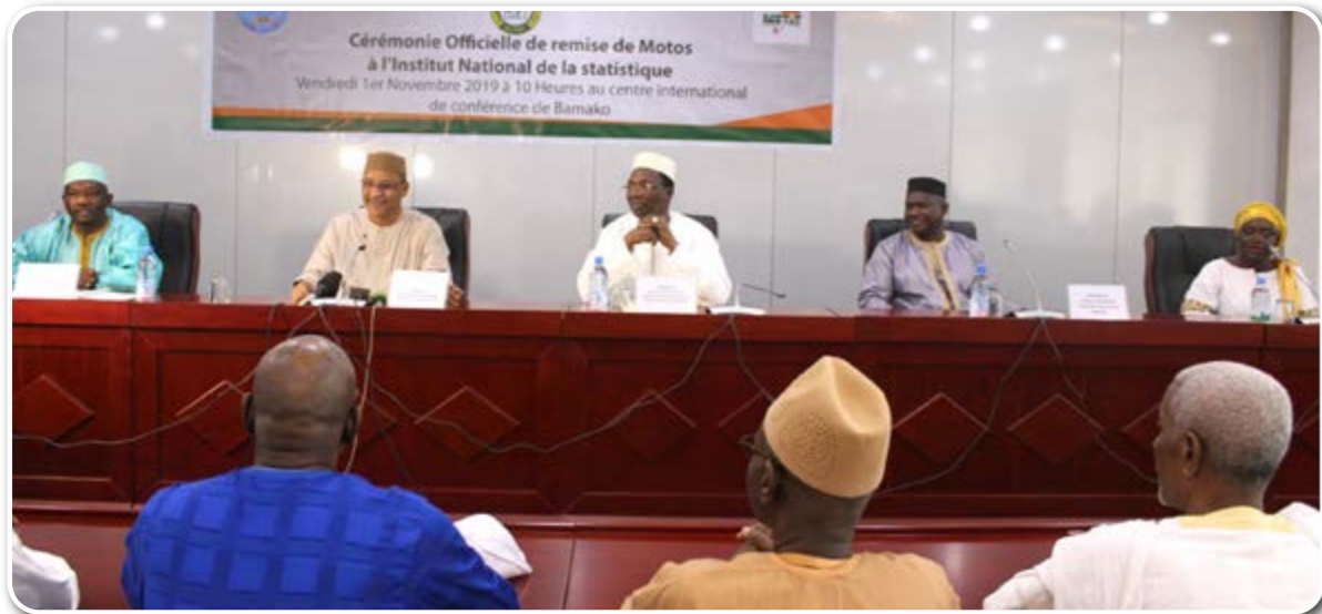
Le Ministère de l'Agriculture a offert à l'INSTAT, le 19 Novembre 2019, des motos dans le cadre de la prise en compte du module RGA dans la Carto du RGPH5