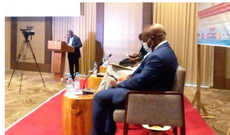
Le DG de l'INSTAT s'adressant au public lors de la cérémonie de présentation des résultats de la cartographie

Entre autres produits obtenus des travaux de cartographie, on peut citer la liste des sections d'énumération et leurs cartes (en vue de l'organisation du dénombrement) ; le répertoire actualisé des localités du Mali ; le fichier des infrastructures communautaires de base (utile à la planification du développement) et la base de données sur le secteur agricole (sollicité par le ministère de l'agriculture dans le cadre de l'organisation du Recensement Général de l'Agriculture).