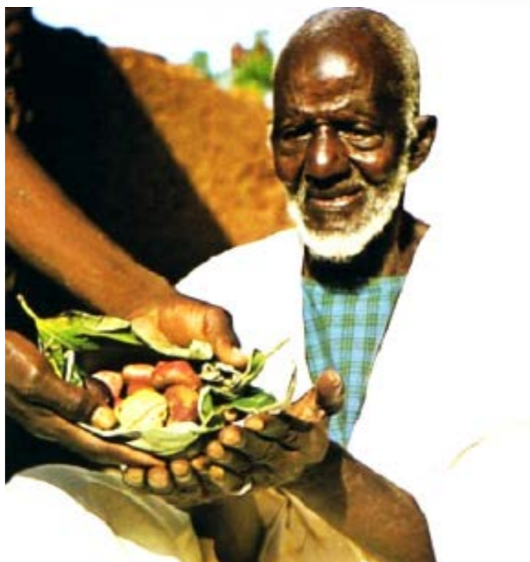
Le RGPH5 devra traiter de nombreux indicateurs de développement du pays

Outre l'Etat malien qui s'est engagé à accompagner le Recensement à hauteur de 5 milliards de F CFA, le processus de mise en œuvre de l'opération était, jusqu'à la tenue de cette conférence, accompagné par la Banque Mondiale, le Japon, la Norvège, les Pays-Bas, la Suède, l'Allemagne, l'UNHCR, l'UNFPA et l'USAID, à travers des appuis techniques et/ou financiers.