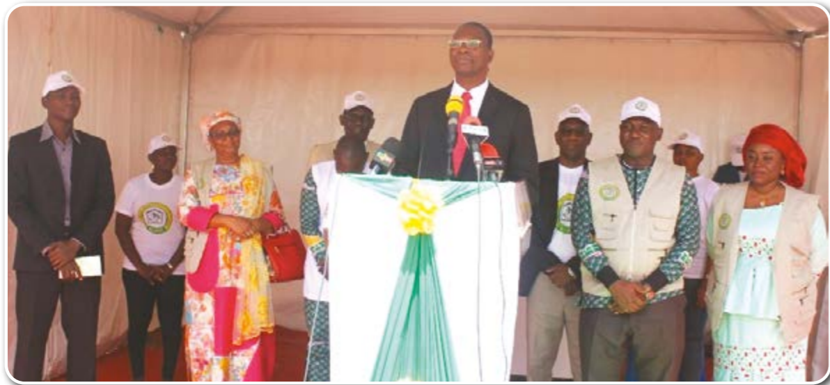
Le Ministre de l'Aménagement du territoire, lançant officiellement les travaux de terrain de la cartographie, le 21 mai 2019