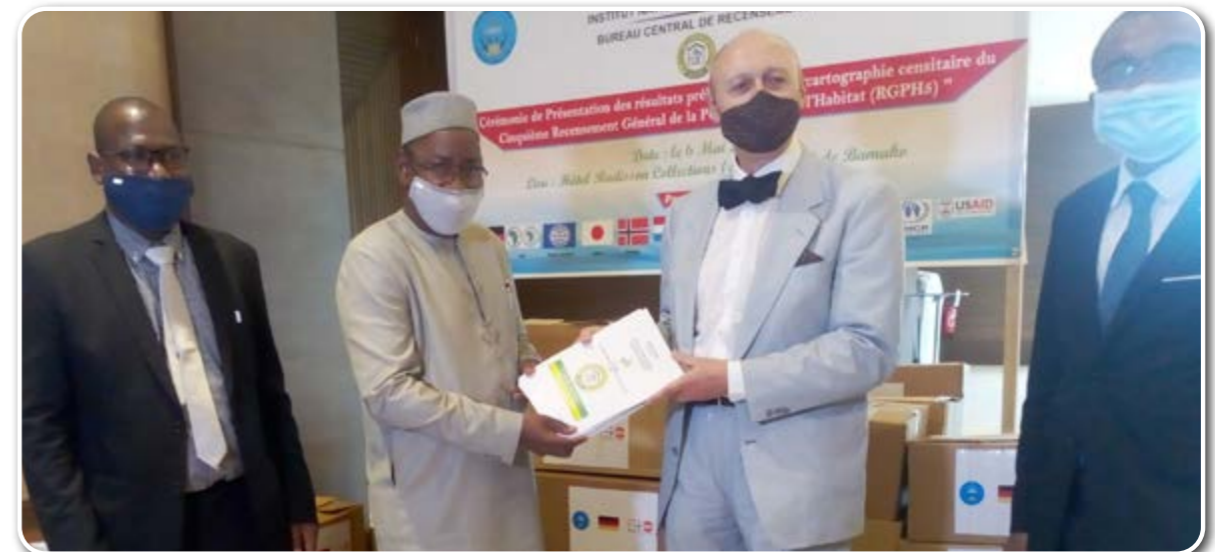
Remise symbolique des outils de travail du RGPH5, imprimés par l'Ambassade d'Allemagne le 06 Mai 2021