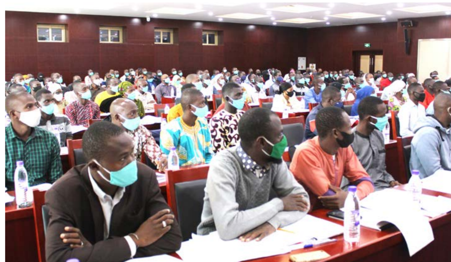
Une vue d'une des sept salles de Formation des contrôleurs TIC

Le dénombrement général du RGPH5 est prévu en novembre - décembre 2021. Le représentant du ministre a souligné que le Gouvernement de transition est engagé « à tout mettre en œuvre pour que cette phase ultime de l'opération puisse se dérouler à la période prévue ».